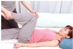
接骨施術・ストレッチ