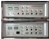
アキュスコープ&マイオパルス